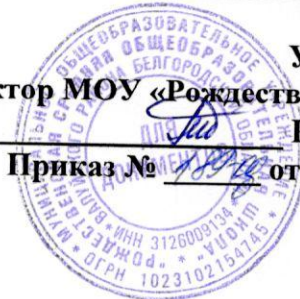
График посещения школьной столовой комиссией по контролю организации и качества питания на 2023-2024 учебный год